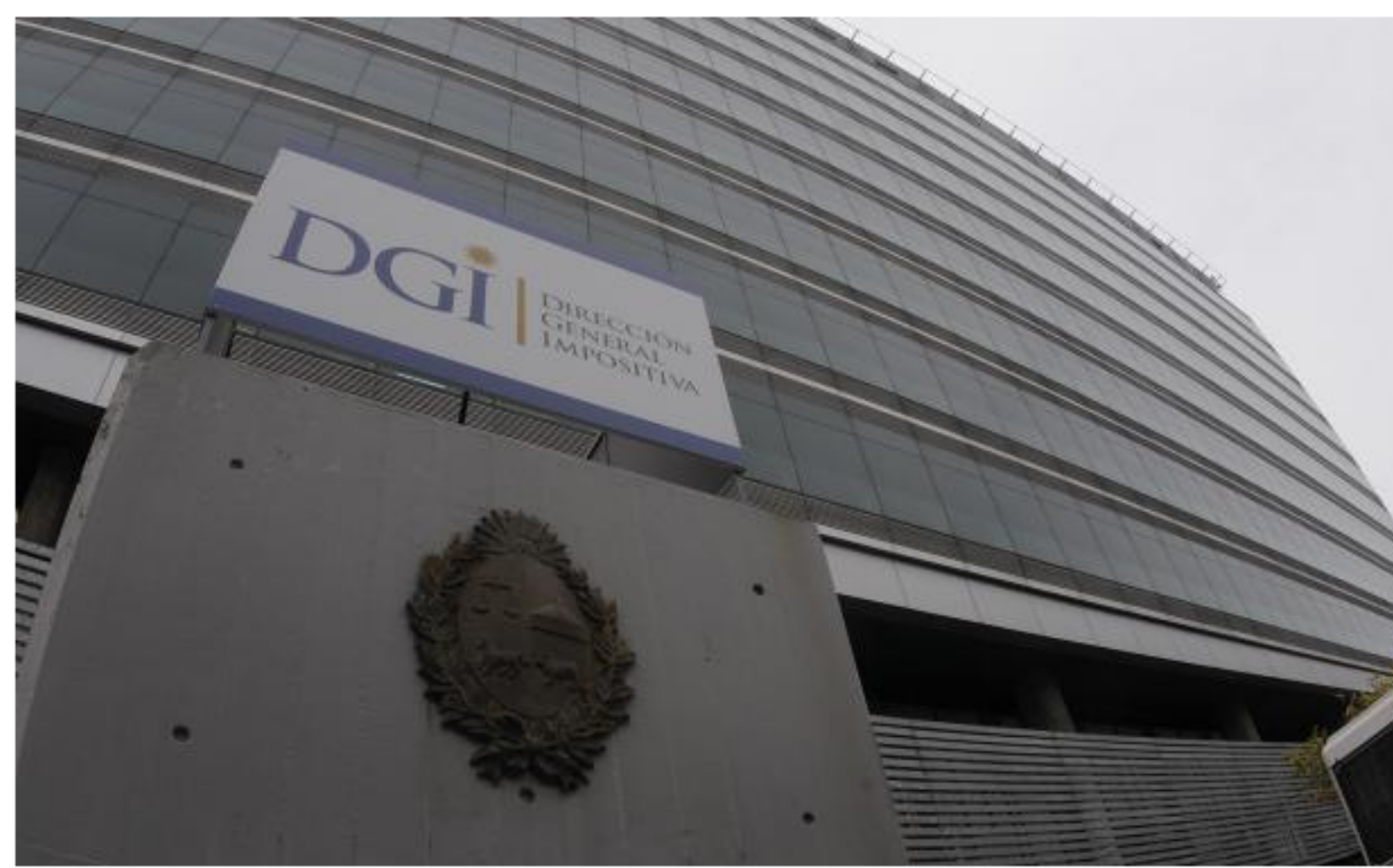
Tributaristas critican el funcionamiento de la DGI.