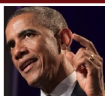
Fuerte aumento del crecimiento económico y mejora del empleo en EEUU