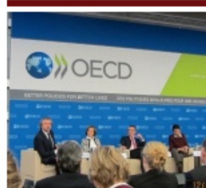
Para cumplir con OCDE, Uruguay debería cambiar secreto bancario