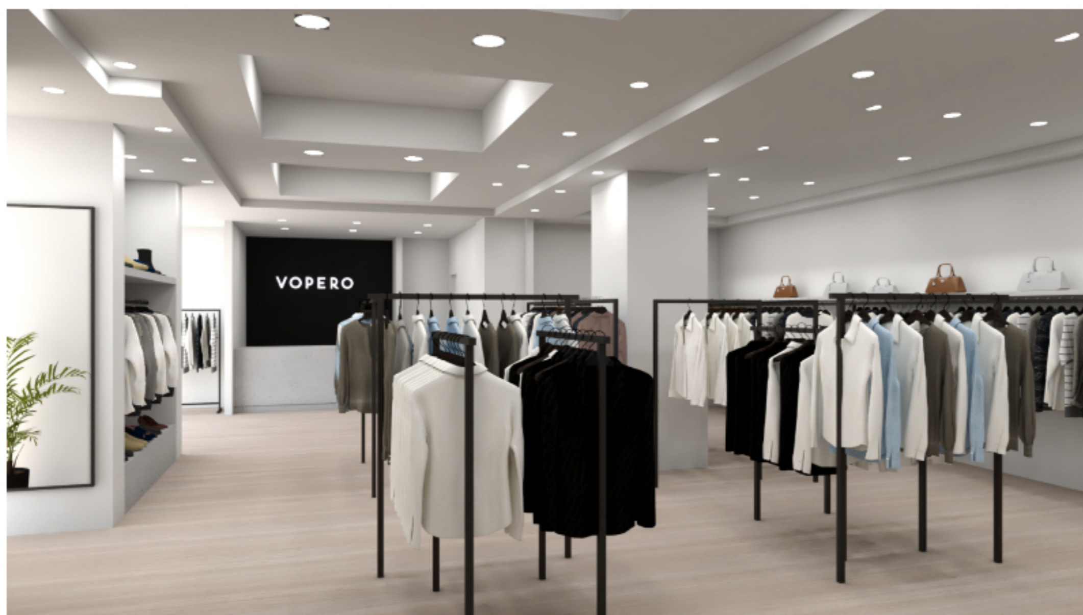
Vopero. El local tendrá 140 metros cuadrados y ofrecerá cerca de 1.500 prendas.

Para este desembarco, Vopero desembolsó US$ 150.000 en la puesta a punto de una tienda de unos 140 metros cuadrados (m2) ubicada sobre una de las entradas del centro comercial.