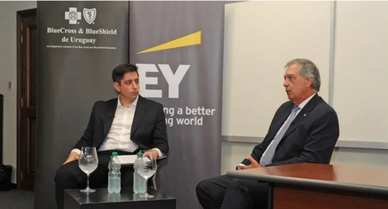
El ministro Fernando Mattos consideró que Uruguay tiene mejores condiciones competitivas que Argentina y Brasil para ingresar a mercados que exigen sostenibilidad en importaciones.

El ministro de Ganadería, Agricultura y Pesca (MGAP), Fernando Mattos , analizó los desafíos que enfrenta el Uruguay a futuro en materia de sostenibilidad como estrategia comercial , durante el ciclo de charlas de management y negocios de la Universidad ORT .