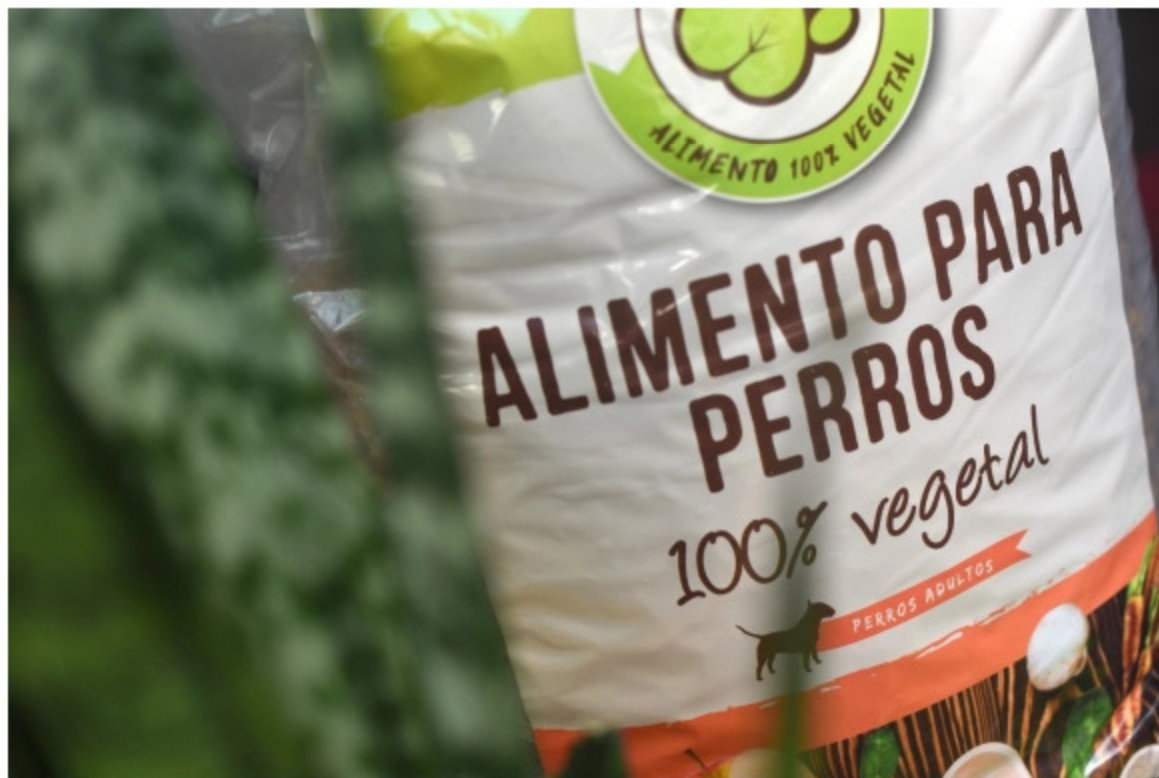
El alimento se elabora con proteína vegetal y contiene nutrientes como omega 3 y omega 6, calcio y fósforo, entre otros.

Greenpet debuta en el mercado con una partida de 3.000 kilos que vende exclusivamente en su sitio de e-commerce . Llegar hasta este punto insumió dos años; su historia emprendedora comenzó en 2019 al buscar alimentos que no dañaran a una perrita alérgica que conocían.